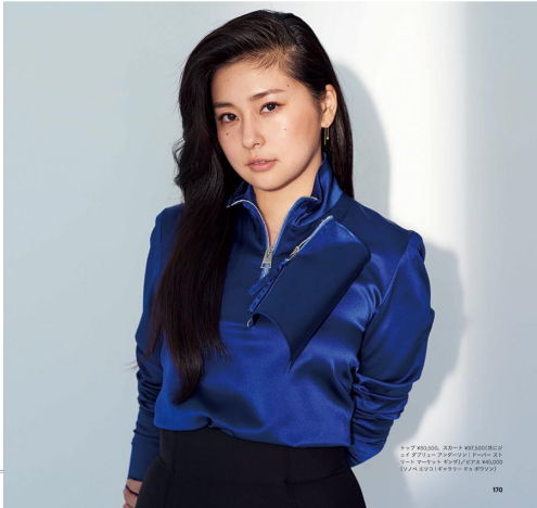
トップ ¥83,300、スカート ¥91,800(限定数量) ニッポン美人化計画 | Erisa | ストリート・マナー | キンワ/ピクアス ¥46,000 (ソノヘ・スリット・ギャザー・トップ・ボウソ)

ロンサバなんてあり得ない? いいえ、ボジティブにとらえて生きていければ、ここまでモードに仕上がります。